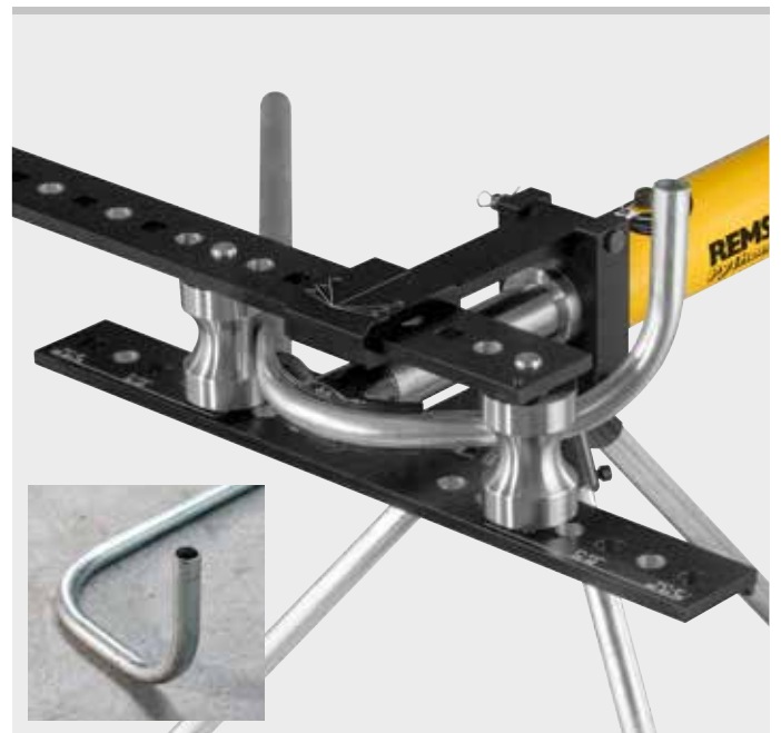
Etagenbogen in mehreren Ebenen.